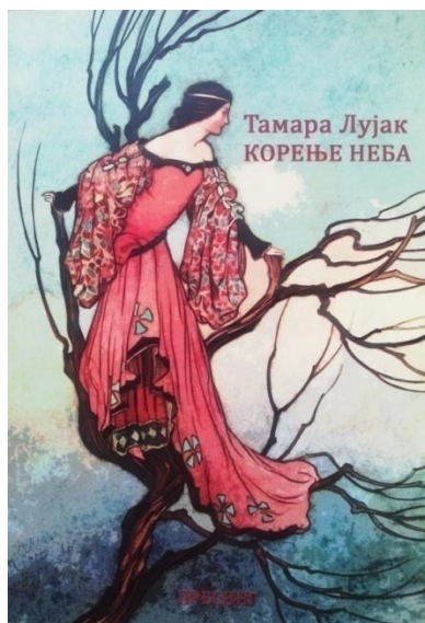
Slika 2: Tamara Lujak, Korenje neba , Presing, Mladenovac, 2018.