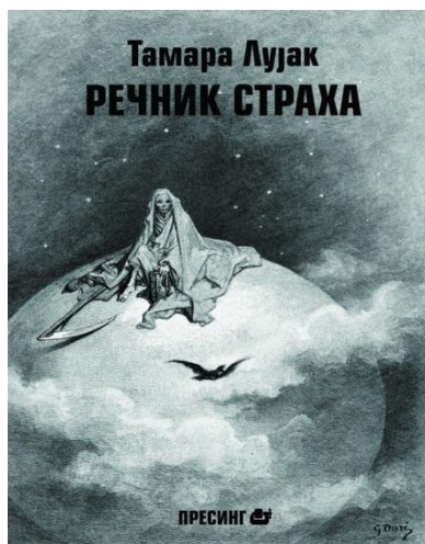
Slika 1: Tamara Lujak, Rečnik straha , Presing, Mladenovac, 2014.

enciklopedijskog, izdanja). Druga dva rečnika još uvek su u rukopisu, pa se ovde po prvi put predstavljaju neke odrednice koje se u njima nalaze.