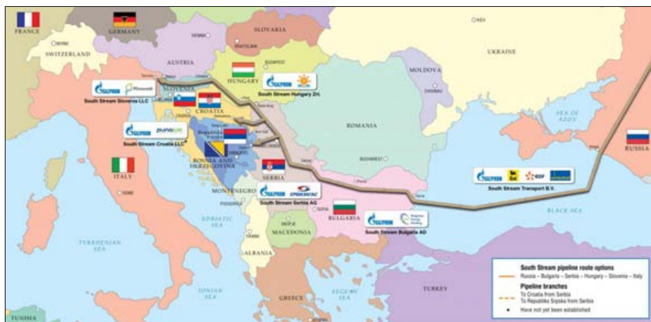
Slika 3 – Blokirani projekat gasovoda Južni tok

Južni tok imao je svog konkurenta u američkom projektu Nabuko . Ali, to je bio iluzorni projekat, jer gasa za Nabuko nije bilo. Gas iz Turkmenije, koji je trebalo da puni Nabuko , prema sporazumu Moskve i Ašhabada, preusmerio se preko Rusije. Pored toga, azarbejdžanski snabdevač gasom Šah Deniz , koji je takođe bio planiran da bude dobavljač gasa u Nabuko iz kaspiskog regiona preko Azerbejdžana u Tursku, odustao je od Nabuko 2013. godine – jer nije bilo dovoljne količine gasa. Jednostavno, američki planovi i obećanja, kojima vrše pritisak na balkanske zemlje, nemaju nikakvih garancija, jer su nerentabilni i neekonomični. Đukić ističe da se gasovodi dugi nekoliko hiljada kilometara sa kapacitetom ispod 30 mlrd. kubnih metara gasa godišnje ne mogu ekonomski isplatiti. 26 Dakle, i izmišljeni projekat Nabuko govori da se radi samo o obliku američkog pritiska i onemogućavanja Rusije da, zajedno sa balkanskim zemljama, realizuje isključivo ekonomske projekte.