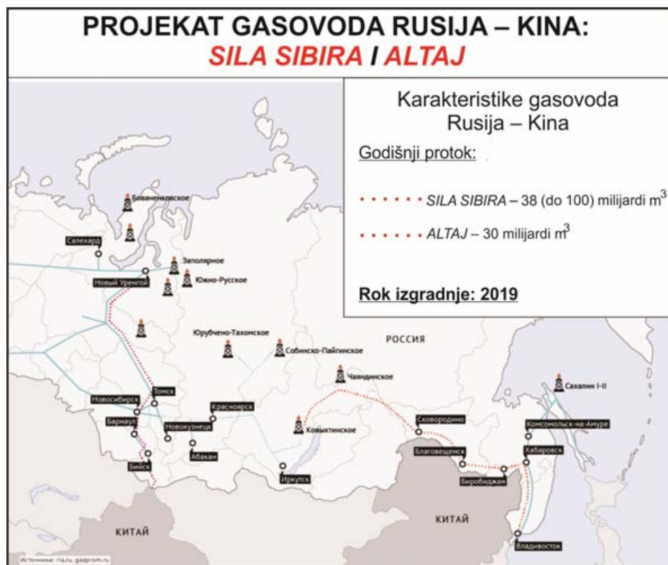
Slika 6 – Projekat gasovoda Rusija–Kina

Inače, energetski sporazum sa Kinom vredan je 400 mlrd USA dolara sa cenom od 360 do 390 dolara za 1000 m 3 gasa. Gasovod treba da ima dva kraka: Sila Sibira (Istočni tok) , koji ide od Irkutsk u Sibiru do Vladivostoka sa krakovima prema Kini, i gasovod Altaj (Zapadni tok) , koji ide iz zapadnog Sibira ka kineskoj provinciji Sindžiang. Rok izgradnje oba gasovoda je 2019. godina. Godišnji protok Istočnog toka je 38 milijardi m 3 gasa, sa mogućnošću da posle 2018. godine naraste na 100 milijardi m 3 gasa. Protok Zapadnog toka je 30 milijardi m 3 gasa godišnje (slika 6).