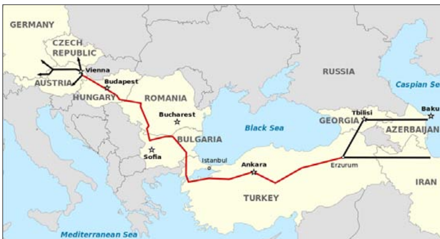
Slika 4 – Američki projekat gasovoda Nabuko (Nabucco)

tadašnji evropski komesar za energiju Ginter Etinger (Günther Oenttiger) naglasio je da usklađivanje poslovanja „Gasproma” sa pravilima EU mora trajati najmanje tri godine. 27