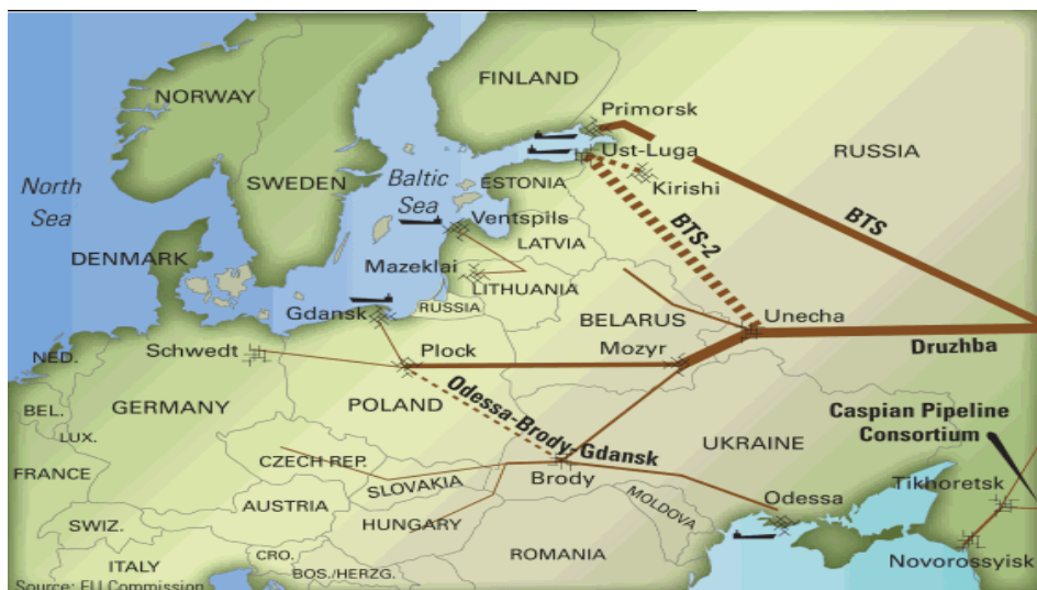
Slika 8 – Naftne luke Rusije u Baltičkom moru sa naftovodima BTS

Što se tiče izgradnje novih naftovoda u evropskom delu Rusije, ona je veoma brzo, posle ulaska baltičkih država u NATO, izgradila novu luku na obali Baltičkog mora (2006. godine u Primorsku u Finskom zalivu) i gotovo celu isporuku nafte, koja je do tada išla preko ovih zemalja za srednju Evropu, usmerila na Primorsk, izgradivši i novi naftovod do nje ( Baltički naftovodni sistem 1, engl. BTS ). Dalje se nafta otprema tankerima za Nemačku. Vrednost Primorska je 2,2 milijarde dolara sa kapacitetom 1,3 miliona barela nafte na dan. Isto tako, 2012. godine puštena je nova luka u Finskom zalivu Ust-Luga, kao i naftovod do nje ( Baltički naftovodni sistem 2, engl. BTS-2 ). Kapacitet naftovoda do luke u Primorsku je 75 miliona tona, a naftovoda do luke u Ust-Lugu je 50 miliona tona godišnje (slika 8).