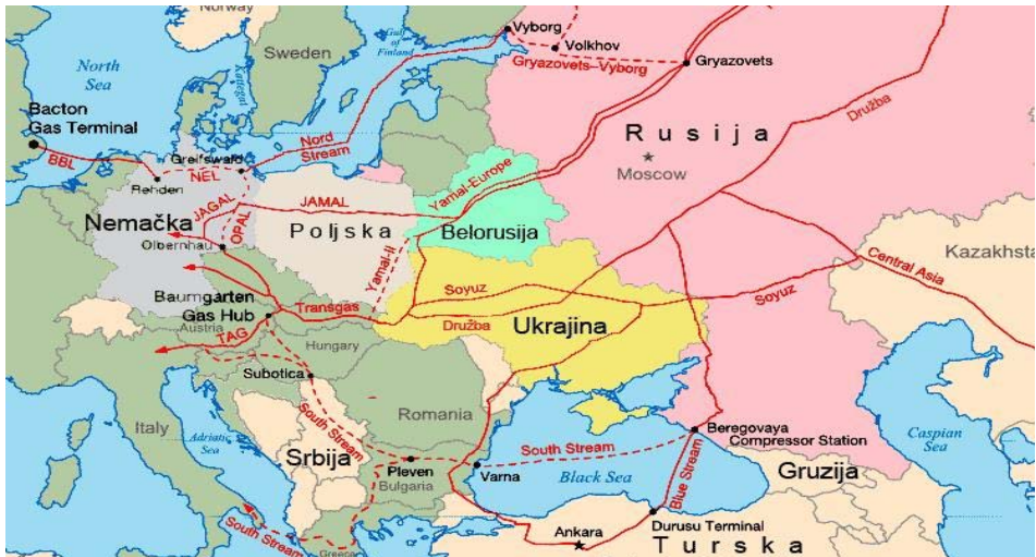
Slika 1 – Maršrute ruskih gasovoda u Evropi

Ruska energetska politika najbolje se uočava kroz strategiju izgradnje novih naftnih i gasnih cevovoda. Težište njihove izgradnje u poslednjih nekoliko godina usmereno je ka obilaženju onih država koje su došle pod političku zavisnost od SAD, a kroz koje prolaze gasovodi izgrađeni za vreme Sovjetskog Saveza.