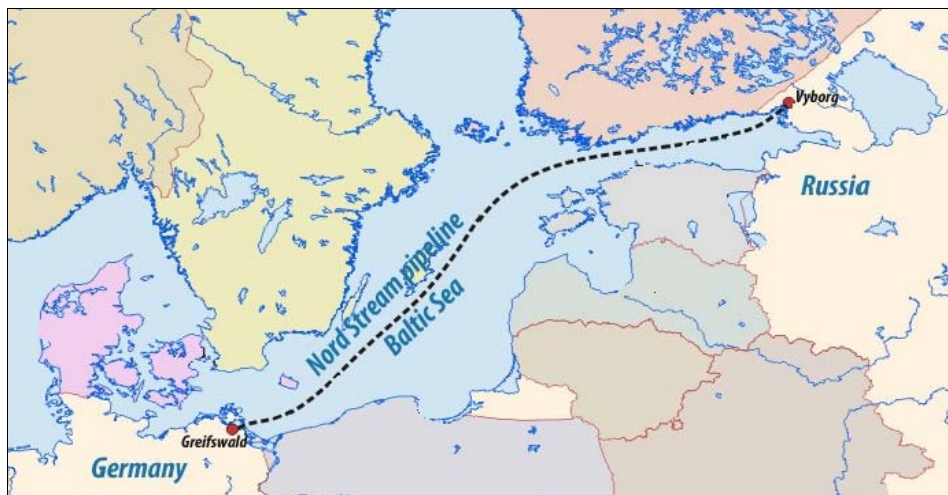
Slika 2 – Maršruta gasovoda Severni tok

je zajednički konzorcijum čiji je predsednik Gerhard Šreder, u kojem ruski „Gasprom” ima udeo od 51%, a dve nemačke kompanije po 24,5%. Cena radova bila je 5,7 milijardi evra, a kapacitet je 55 mlrd m 3 godišnje. Gasovod je pušten u rad 2010. godine. 23 Tržište koje ovaj gasovod pokriva je u zapadnoj Evropi (Nemačka, Danska, Francuska, Velika Britanija), a zaobiđene su Poljska i Baltičke zemlje, kao eksponenti američke politike u Evropi.