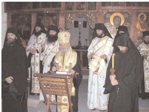
Бденије у манастиру Бањска From the vigil at the Monastery of Banjska.