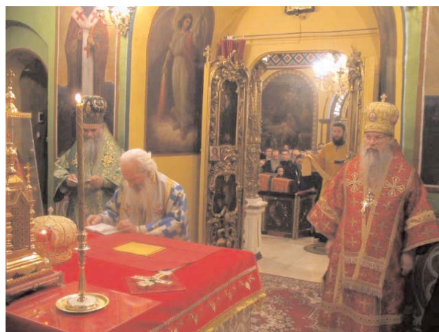
Његова Светост Патријарх Павле на Литургији у Москви His Holiness Patriarche Pavle during the service in Moscow