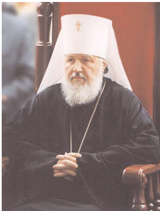
Митрополит Смоленски и Калињинградски Кирило Metropolitan of Smolensk and Kaliningrad Kiril

We hear about the ability of the world community to settle conflicts by bringing people to peaceful coexistence. However, practice shows that the establishment of the monoethnic territories, divided by frontiers and walls, sometimes gives real guaranties of security. Moreover, the most