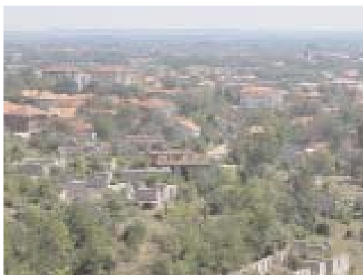
Рушевине села Љуг и панорама Истока Ruins of village Ljug and panorama of town

On the road to Djurakovac, which passes through the center of Istok, from the bus we can see the small old Serbian gravestones standing crookedly in the grass surrounded by highrises. Some of them are right