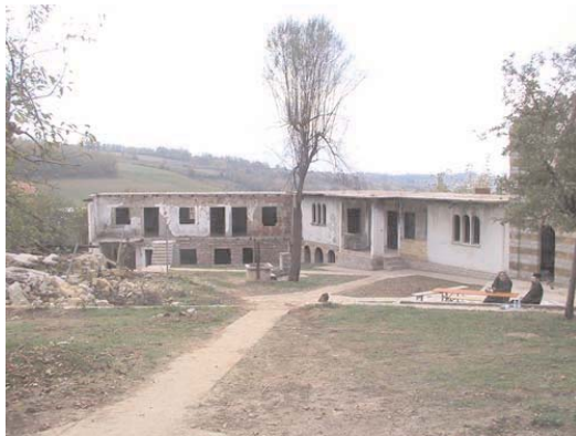
Манастир Зочиште, снимак од 28. 10. 2004. Zociste Monastery, photo from 28. 10. 2004.

Манастир Св. Козме и Дамјана (Свети Врачи) у Зочишту подигнут је у 14. веку. Први пут се помиње у хрисовуљи Св. Краља Стефана