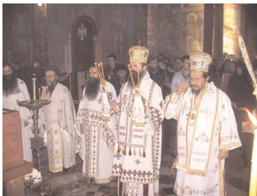
Литургија у манастиру Дечани Service in Monastery Decani