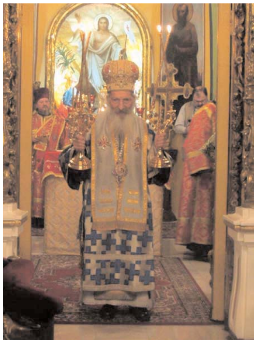
Његова Светост Патријарх Павле His Holiness Patriarche Pavle

Patriarch Pavle served Holy Hierarchical Liturgy on the feast of the Renovation of the Church of St. George (Djurdjic) in the church of the Holy Apostles Peter and Paul in the Podvorye of the Serbian Orthodox Church